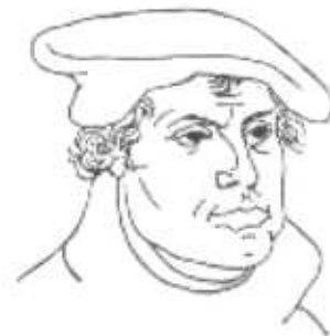
Martin Lutero (Lucas Cranach el viejo, 1523).

En medio de sus inquietudes sobre la propia salvación y cuando creía haber encontrado la respuesta a ellas en la justificación por la sola fe, se cruzó la predicación de una indulgencia con vistas a obtener fondos para construir la basílica de San Pedro en Roma. El papa Julio II había encargado a Bramante en 1505 la edificación de la basílica y como de costumbre concedió una indulgencia plenaria. Es bastante verosímil que algunos predicadores se excedieran en sus exhortaciones. La leyenda pone en sus bocas frases tales como : «Tan pronto cae el dinero en el cepillo, el alma sale del suplicio».