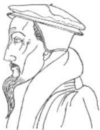
Juan Calvino - Anónimo del s. XVI.

El francés Juan Calvino, nacido en 1505, filósofo, jurista, teólogo, exégeta y humanista, se adhirió a la reforma a los 24 años renunciando a los beneficios de que disfrutaba. El punto característico de su doctrina puede ser el de la predestinación a la salvación o a la condenación . Las obras de los fieles no serían más que un signo de