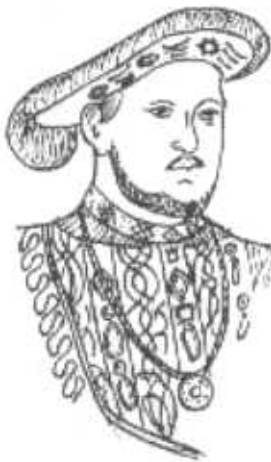
Enrique VIII (H. Holbein, 1549).

ejecutados. Entre los monjes, la resistencia fue mayor, y fue aprovechada para apoderarse de sus bienes en favor del rey y sus amigos. Entretanto, el pueblo siguió las prácticas católicas de siempre y hasta más tarde no se favoreció el protestantismo.