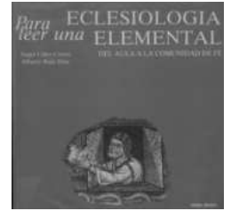
ORIGEN DE LAS IGLESIAS ACTUALES MAS IMPORTANTES