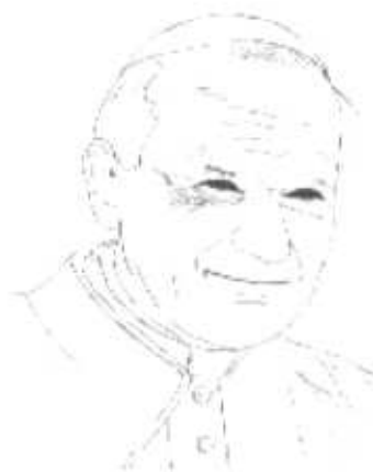
El papa Juan Pablo II.

Por otra parte, la verdadera historia universal ha comenzado. Las inter-relaciones y los medios de comunicación hacen repercutir cualquier acontecimiento en puntos geográficos o culturalmente distantes homogeneizando los problemas.