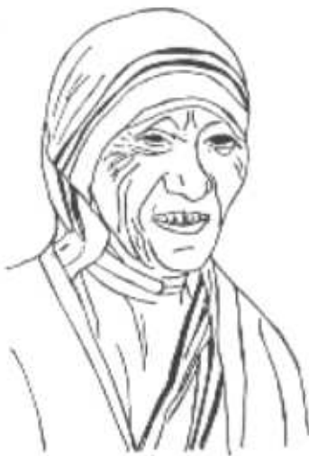
Madre Teresa de Calcuta, premio Nobel de la paz.

La reflexión teológica ha producido en el tercer mundo la llamada teología de la liberación y de la negritud , entre otras líneas menos aceptadas. La liberación no es solamente objeto de reflexión, no es una teología sobre la liberación, sino sobre todo desde la liberación, por lo que su elaboración no es posible desde despachos europeos. Las controversias con otras concepciones de la iglesia que pretenden ser únicas han producido episodios en los que apuntaba el deseo de restauración y, en opinión de algunos, de involución.