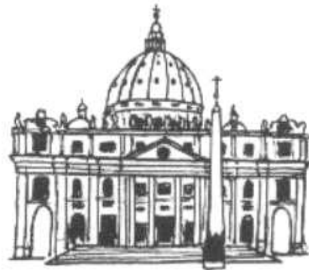
Basilica de san Pedro en Roma, en la que se celebró el Concilio Vaticano II.

Decir que la iglesia es pueblo de Dios significa colocarla en el contexto de la historia de la salvación (que tiene su centro en Jesucristo) y en la intimidad de la historia de los hombres (la iglesia no es un complejo estático de instituciones: sigue las vicisitudes de la historia). De este modo, se subraya la conciencia comunitaria y la exigencia de la encarnación.