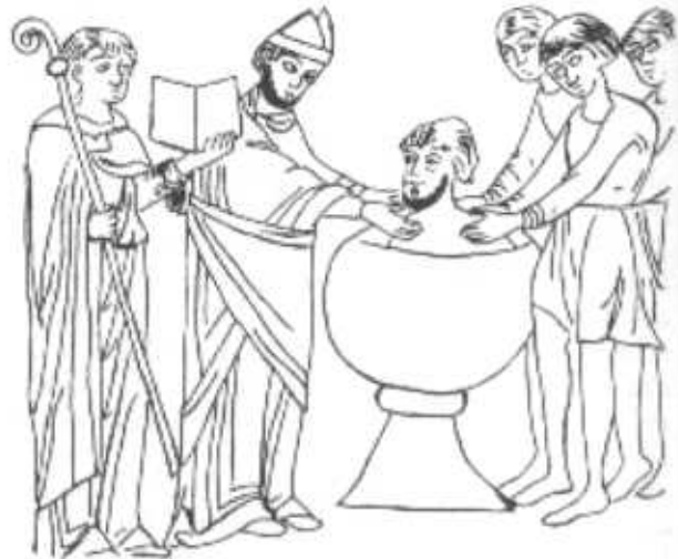
Los niños de Zaragoza son bautizados por el arzobispo Turpin. Dibujo de 1300.