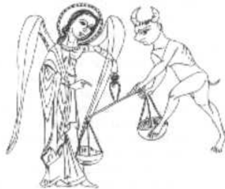
San Miguel pesando un alma (s. XIII). Museo de arte de Cataluña. Barcelona.

3.4. Así, entre los siglos X y XV va cuajando la llamada penitencia personalizada , que ha pervivido hasta nuestros días, en la que la confesión consciente y responsable del penitente y la exhortación pastoral del confesor harán el acto menos mecánico. La autoacusación toma tanto relieve que el sacramento es designado simplemente como «confesión». La absolución se da antes de cumplir la penitencia y aun ésta se reduce a un acto simbólico . La vergüenza de acusarse se considera ya obra penitencial y la misma fórmula u oración del confesor pasa de ser deprecativa a ser indicativa. El rito se desarrolla delante del altar con el ministro sentado en una silla. A finales de la edad media y después en el concilio de Trento, se prescribió un asiento cerrado, que sólo a partir del siglo XVIII se convirtió en el confesonario utilizado hasta hoy. Por este moti-