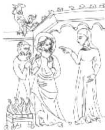
Penitencia a Jesús. Biblioteca Nacional de Madrid.

3.1. La penitencia canónica funcionó desde el siglo III al VI y tenía las siguientes características: era pública , es decir, regulada por la comunidad canónicamente; única para toda la vida y anterior al perdón . Principalmente la idolatría, el homicidio y el adulterio eran interpretados como una especie de negación de la conversión bautismal, por lo cual la comunidad expulsaba de su seno a aquellos que negaban de esta forma su fe. Si ellos deseaban rectificar su actitud y beneficiarse de la segunda penitencia, eran acogidos en el grupo de los penitentes. Para ello confesaban su pecado ante el obispo o su representante (nunca fue obligada una acusación pública concreta),