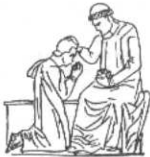
Confesión (Giotto). Catedral de Florencia.

vo, la imposición de manos quedó reducida a una mera elevación por parte del sacerdote.